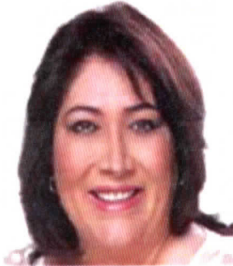
Dip. Nelly del Carmen Márquez Zapata