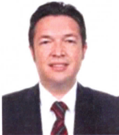
Dip. Próspero Manuel Ibarra Otero