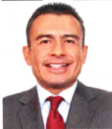
Dip. Fidel Calderón Torreblanca